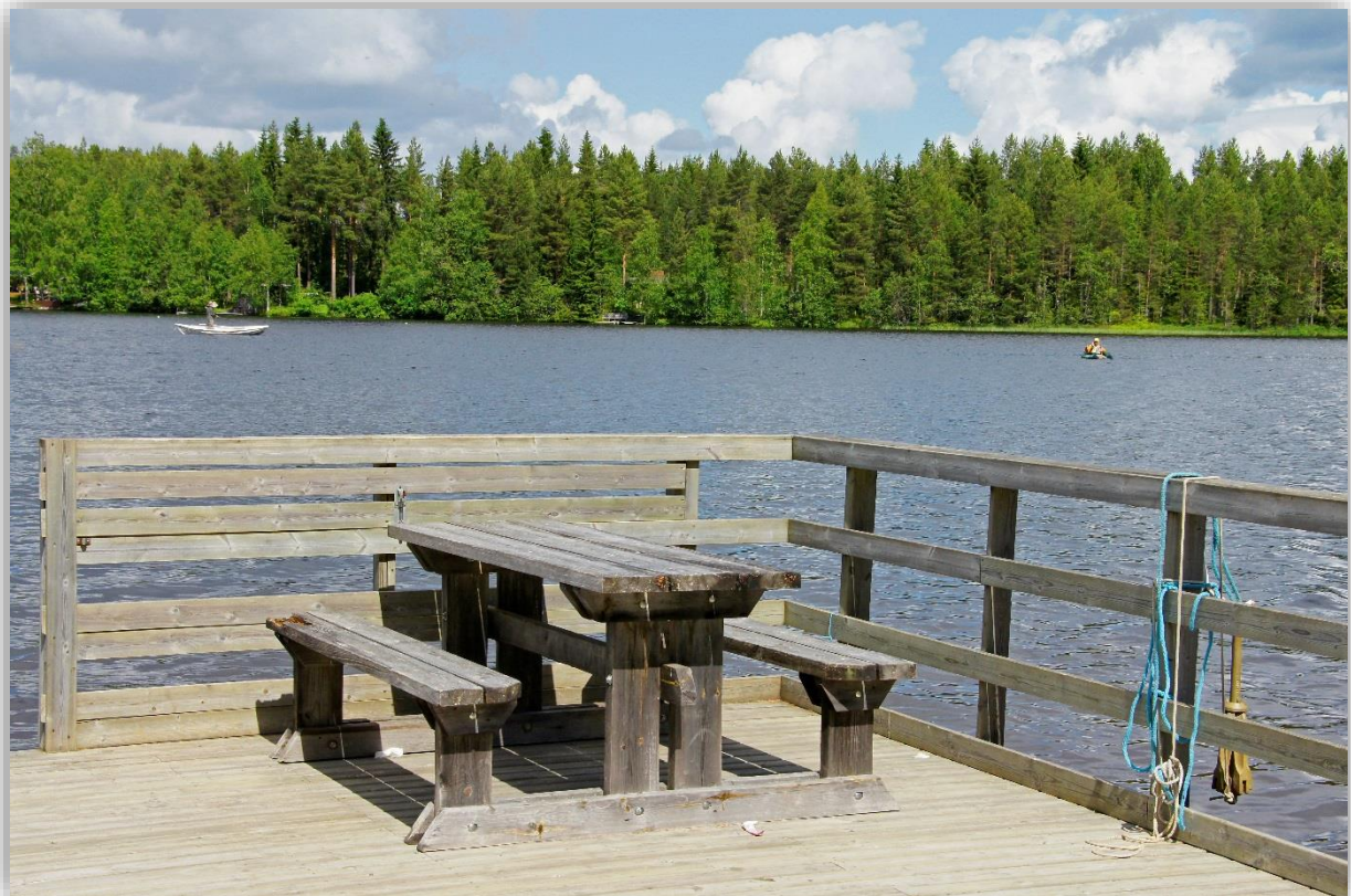
Valkeisjärven laituri Sangilla

Lisää käyntikohteita ja tarkempia tietoja Utajärven internetsivuilta kohdasta Matkailu. Sivuilta löydät myös useiden kohteiden sähköisiä esitteitä.