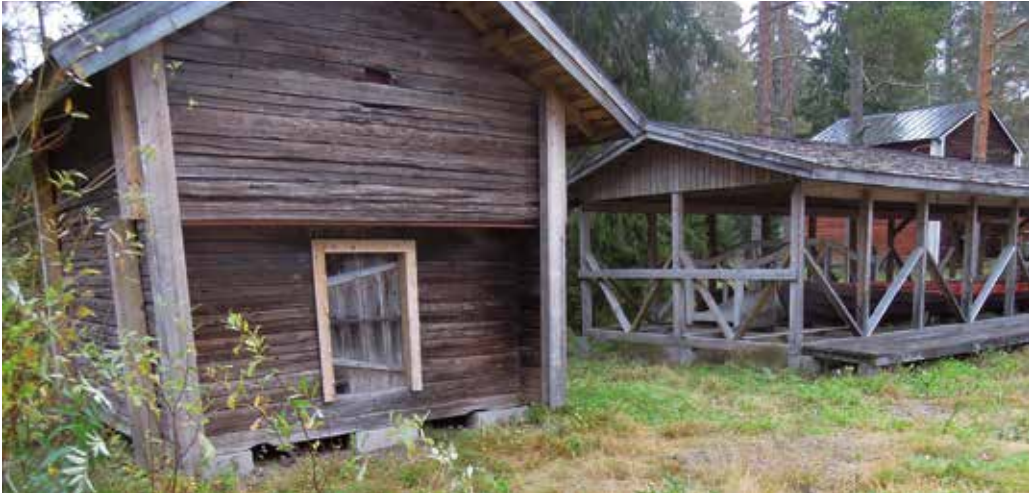
Kotiseutumuseon aitta ja venekatos | Museum of Local History and Culture

Uudistilalliset, kaskenpolttajat ja kalamiehet Limingasta, Oulujoen alajuoksulta ja Savosta saapuivat asuttamaan Utajärveä jo ennen 1500-luvun puoliväliä. Ensimmäiset heistä kohtasivat villin erämaan, mutta vähitellen eri puolille pitäjää alkoi syntyä kyliä, eritoten elämää ylläpitävien jokien varsiin.