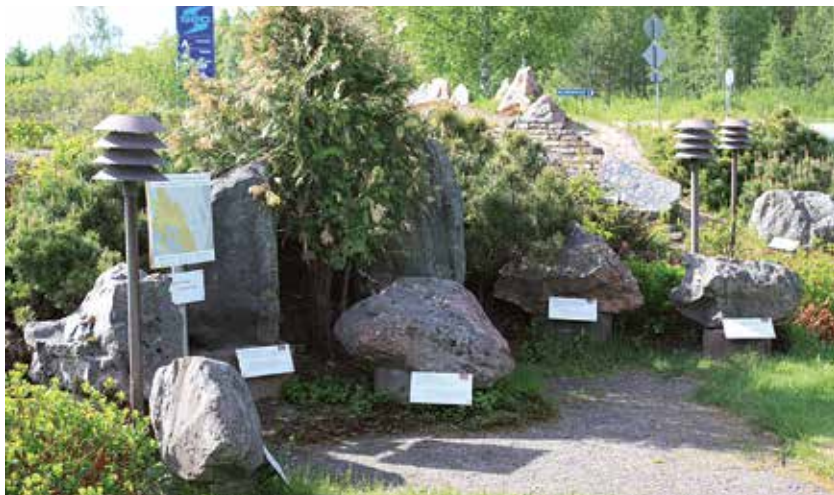
Kivipuisto | The Geological Time Trail

Farmers and fishers inhabited Utajärvi as early as middle of the 16th century. They came from Liminka, Savo and the downstream areas of the river Oulujoki encountering an untouched wilderness. Villages were developed at different locations in the area over time.