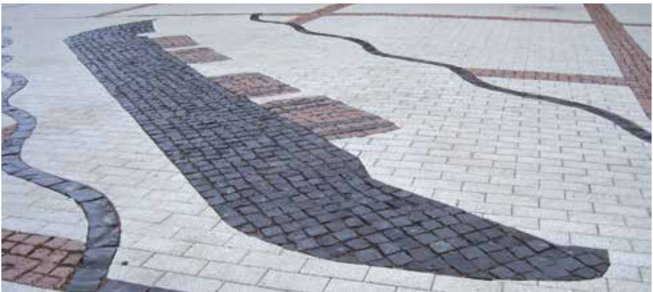
Tervavene torialueen kiveyksessä | A tar boat pictured in a stone paving of the marketplace.