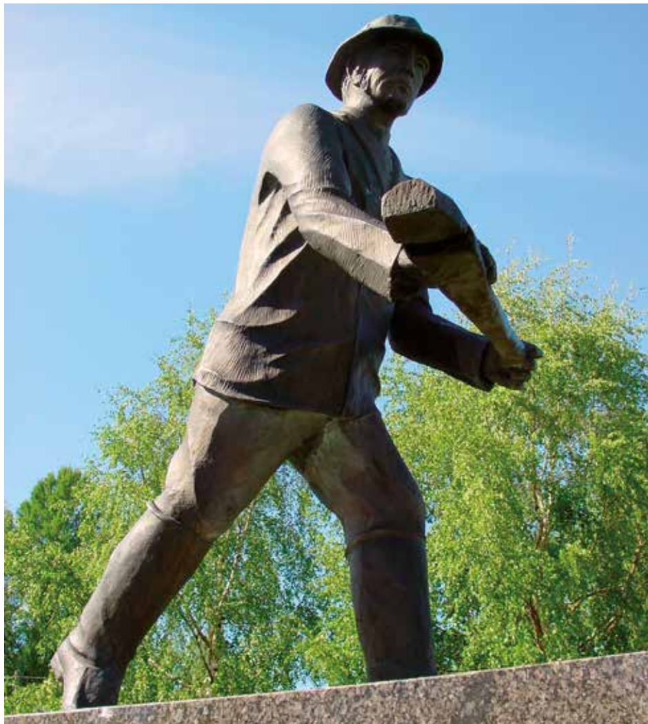
Roomaripatsas | Roomaripatsas statue.