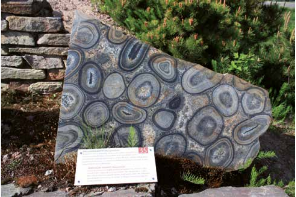
Kivipuisto | The Geological Time Trail

The Kutukukkula Hill is a nice spot for admiring the landscape of Utajärvi. The hill is situated next to the road following the channel embankment, not far away from the town centre. The road was built using the soil and stone debris that were dredged from the river bottom while powerhouses were built in 1950's.