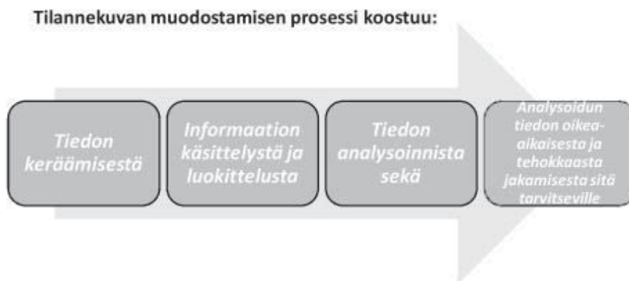
Kuva 2. Tilannekuvan muodostaminen

Tilannekuvan muodostaminen on esitetty kuvassa 2.