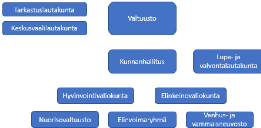
Kaavio. Utajärven kunnan luottamushenkilöorganisaatio.

Kunnassa on nuorisovaltuusto sekä vanhus- ja vammaisneuvosto, joiden kokoonpanosta, asettamisesta ja toimintaedellytyksistä päättää kunnanhallitus. Ne eivät ole kunnan viranomaisia, vaan toimivat edustamansa väestöryhmän vaikuttamis- ja osallistumiskanavana.